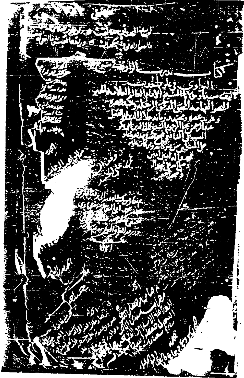
صورة من المخطوط النسخة (ب)